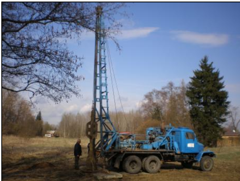
Foto 5 – HV 3 – vrtná souprava RNM (nárazovo-točivá technologie vrtání)