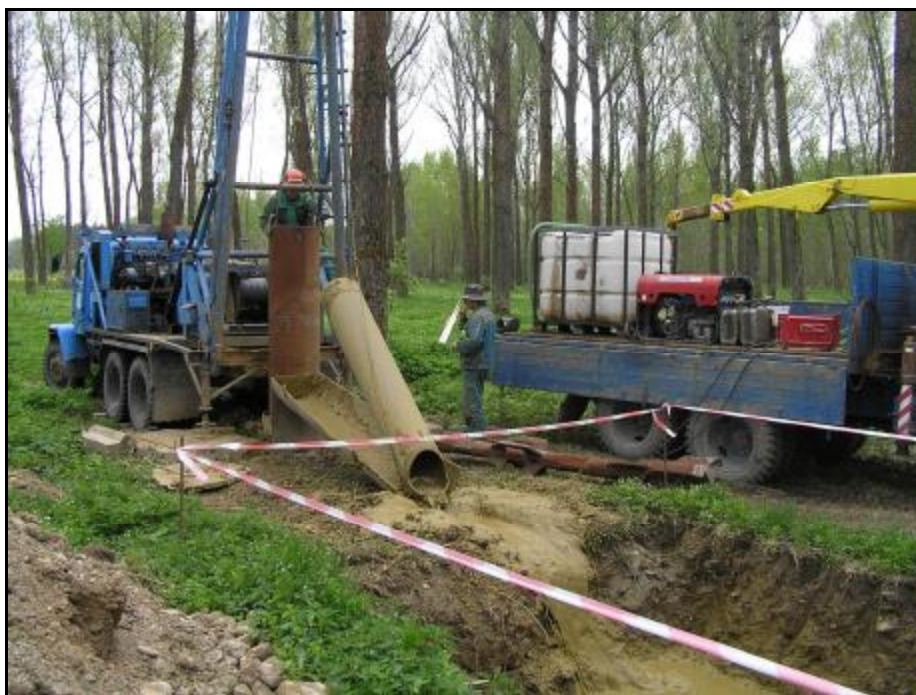
Foto 17 – HV 1 – vrtná souprava RNM (nárazovo-točivá technologie vrtání)