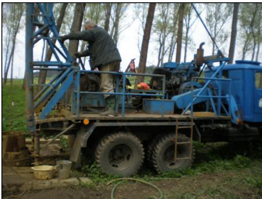
Foto 9 – HV 2 – vrtná souprava RNM (nárazovo-točivá technologie vrtání)