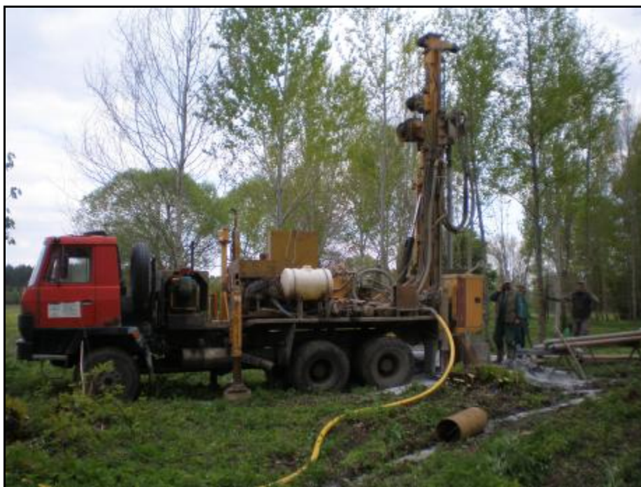
Foto 13 – HV 4 – vrtná souprava Aquadrill A-800 (rotačně-příklepová technologie vrtání)