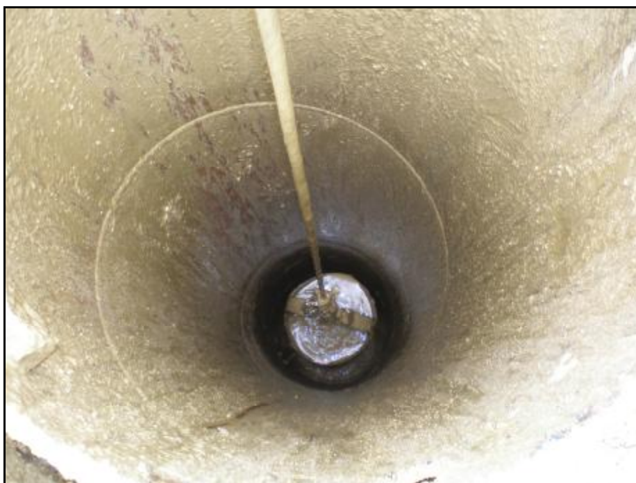
Foto 18 – HV 1 – měření úrovně hladiny vody před vystrojením vrtu